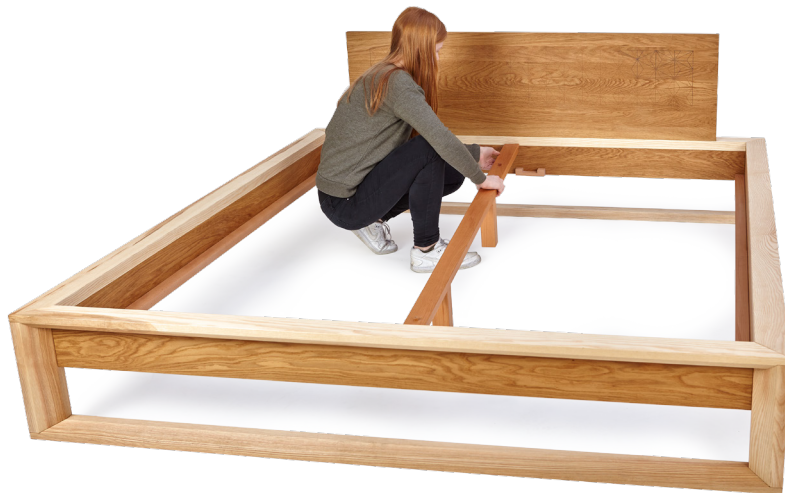
4. Bei Betten ab 160 cm Breite: Mittelsteg einlegen.