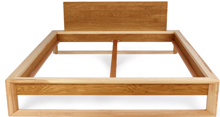
5. Fertig! Jetzt können die Lattenrost(e) in den Bettrahmen gelegt werden.