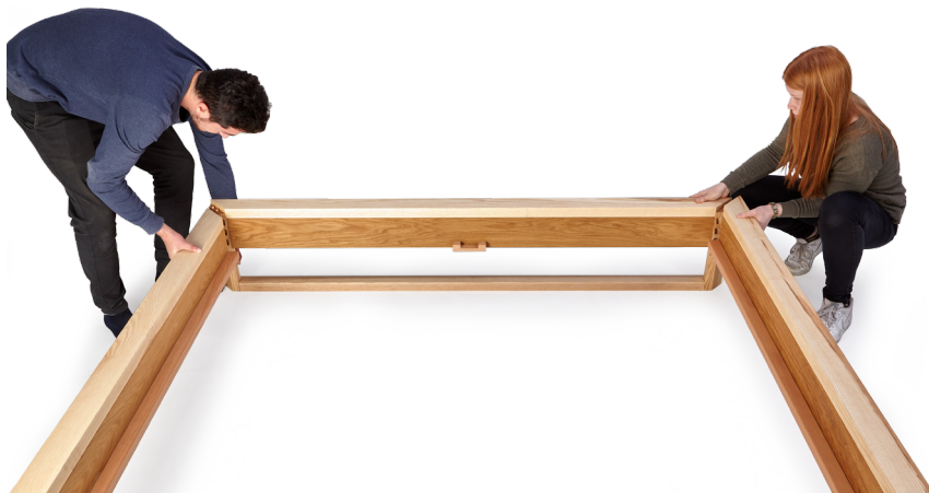
3. Die Seitenwangen mit dem Fußteil verbinden (wie unter 2.).